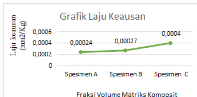
Figure 3. Grafik uji keausan pada spesimen