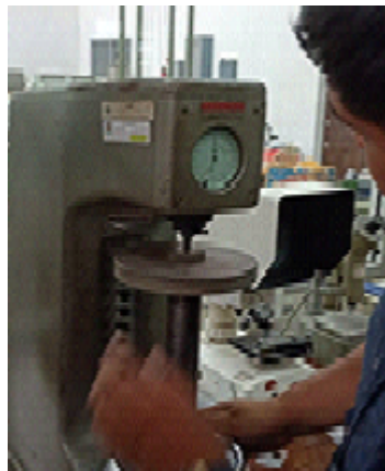
Figure 2. Pengujian Kekerasan