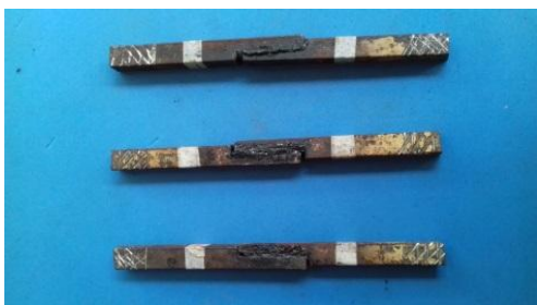
Gambar 3. Benda uji setelah di beri adhesif dengan penambahan 1 gr gula pasir