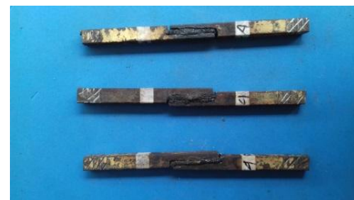
Gambar 6. benda uji setelah di beri adhesif dengan penambahan 4 gr gula pasir

1 gram gula Spesimen 1 Tebal plat (t) : 10mm Lebar plat (L) : 15 mm Lebar pengeleman (I) : 15 mm Beban maksimum (f) : 98 Kgf