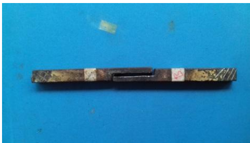
Gambar 2. Benda uji sebelum pengeleman