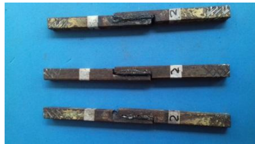
Gambar 4. benda uji setelah di beri adhesif dengan penambahan 2 gr gula pasir