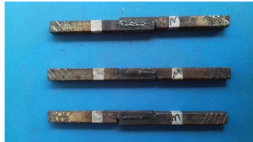
Gambar 5. benda uji setelah di beri adhesif dengan penambahan 3gr gula pasir